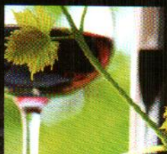
Nero d'Avola di Roberto Rabachino